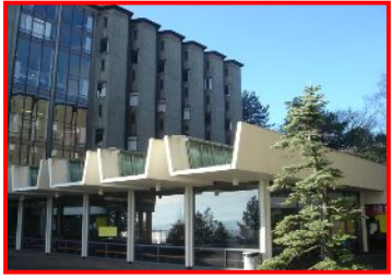
ワシントン大学の学生寮に滞在しながら