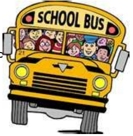
午後はフィールドトリップへ