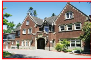
伝統あるフッシュ・ハイスクールで英語クラス