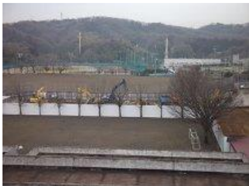
解体工事が急ピッチで進められている現場 (手前高校校庭と奥グラウンドの間)

3月より、いよいよ新築工事が始まります。同時に、管理棟の増築工事も始まりません。