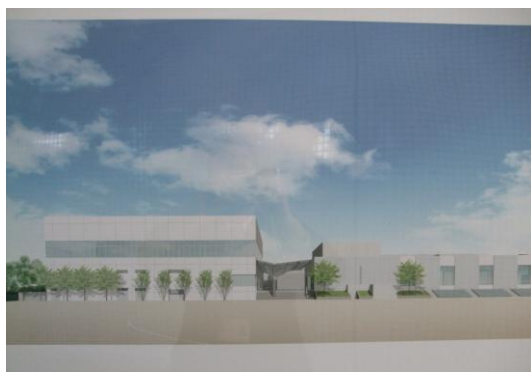
完成予想図① グラウンドより体育館(左)とプール棟(右)

完成予想図は校内大階段上に飾っておりますので、学校に来られた際はぜひご覧になって下さい。