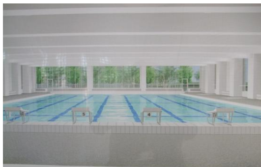
完成予想図② プール棟内部(温水プール)